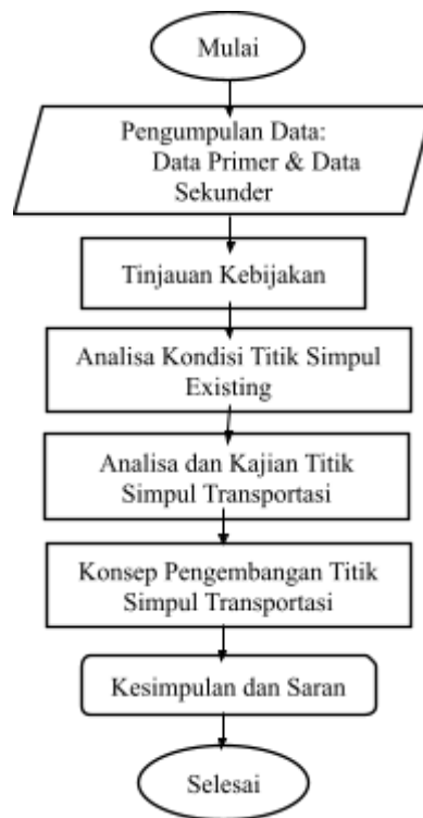
Gambar 1. Bagan alir penelitian